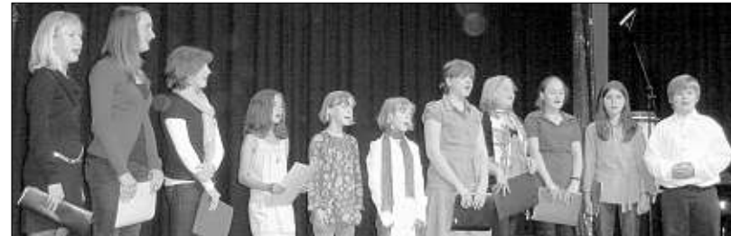
Setzte sich gut in Szene – der singende Nachwuchs des KKG.

Orchester, Big-Band, Chöre und Instrumentalsolisten: die Schüler gaben vielfältige Kostproben ihrer musikalischen Fähigkeiten. Das Repertoire, das unter der Fachlei-