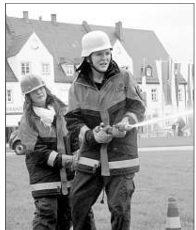
Übungslöschchen am Kapellplatz war eine der Stationen des Wettbewerbs der Jugendfeuerwehren. – Fotos: gs

hat ihr Jubiläum mit 25 Jugendgruppen der Feuerwehren aus dem Landkreis gefeiert. Jugendwart Rupert Maier und seine Kameraden haben sich dazu einen feuerwehrtechnischen Wettkampf mit elf Stationen ausgedacht, bei dem die Ju-