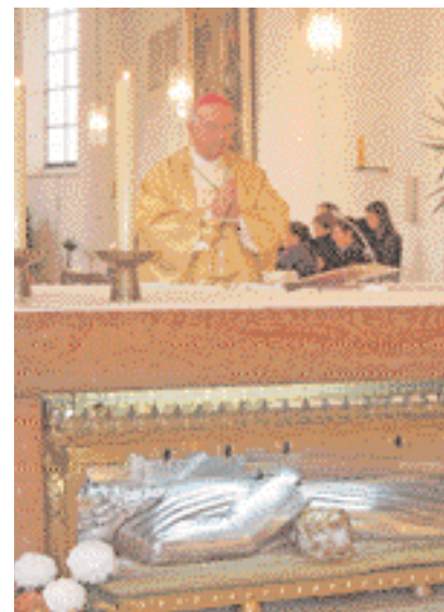
Bischof Wilhelm Schraml während der Eucharistiefeier am Altar mit dem Br. Konradsschrein.

Ein glaubensfrohes Programm erwarte die Pilger nach Altötting im kommenden Jahr, stellte der Bischof fest und bat die Pilgerleiter, ein wenig mitzuhelfen, den Blick auf „diesen heiligen, bescheidenen Kapuzinerbruder“ zu lenken. „Es kommt nicht darauf an Großes und Faszinierendes zu leisten; es kommt darauf an im Kleinen und Alltäglichen treu und bescheiden zu sein“, resümierte Bischof Schraml in seiner Predigt während der hl. Messe in der Br. Konrad-