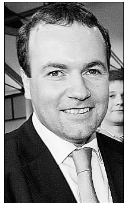
„Ostbayern hat von der Osterweiterung profitiert“, sagt MdEP Manfred Weber (CSU).

Weber: Vor allem die Wirtschaft, insbesondere die Exportwirtschaft, gehört zu den Gewinnern. Bayern, und damit auch Ostbayern, ist für Tschechien und den gesamten osteuropäischen Raum mittlerweile mit der größte Handelspartner. Vom grenznahen Einzelhändler bis zur Milch-veredelnden Molkerei haben viele von der Osterweiterung profitiert. Verloren haben dagegen manche Dienstleister im Grenzraum, aber auch die Tankstellen: Sie haben zusätzliche Konkurrenz bekommen. Ihnen müssen wir darum stärker unter die Arme greifen. Eines möchte ich aber noch anmerken: Seit einem Jahr gilt auch das Schengen-Abkommen mit Tschechien. Die Grenzkontrollen sind seitdem abgeschafft, die Kriminali-